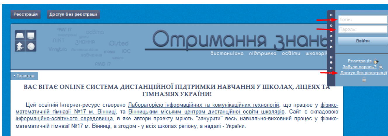
Рис. 2.1. Система «Отримання знань»